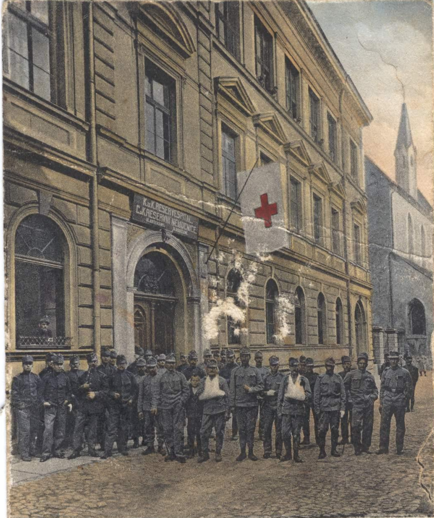
Jindř. Hradec: C. a. k. reserv. nemocnice. Neuhaus: K. u. k. Reservespital.

(Pozn. Na snímku jsou zřetelně vidět 2 přední vchody do školy. Vchodem blíže k nám bylo možno vjet průjezdem na školní dvůr).